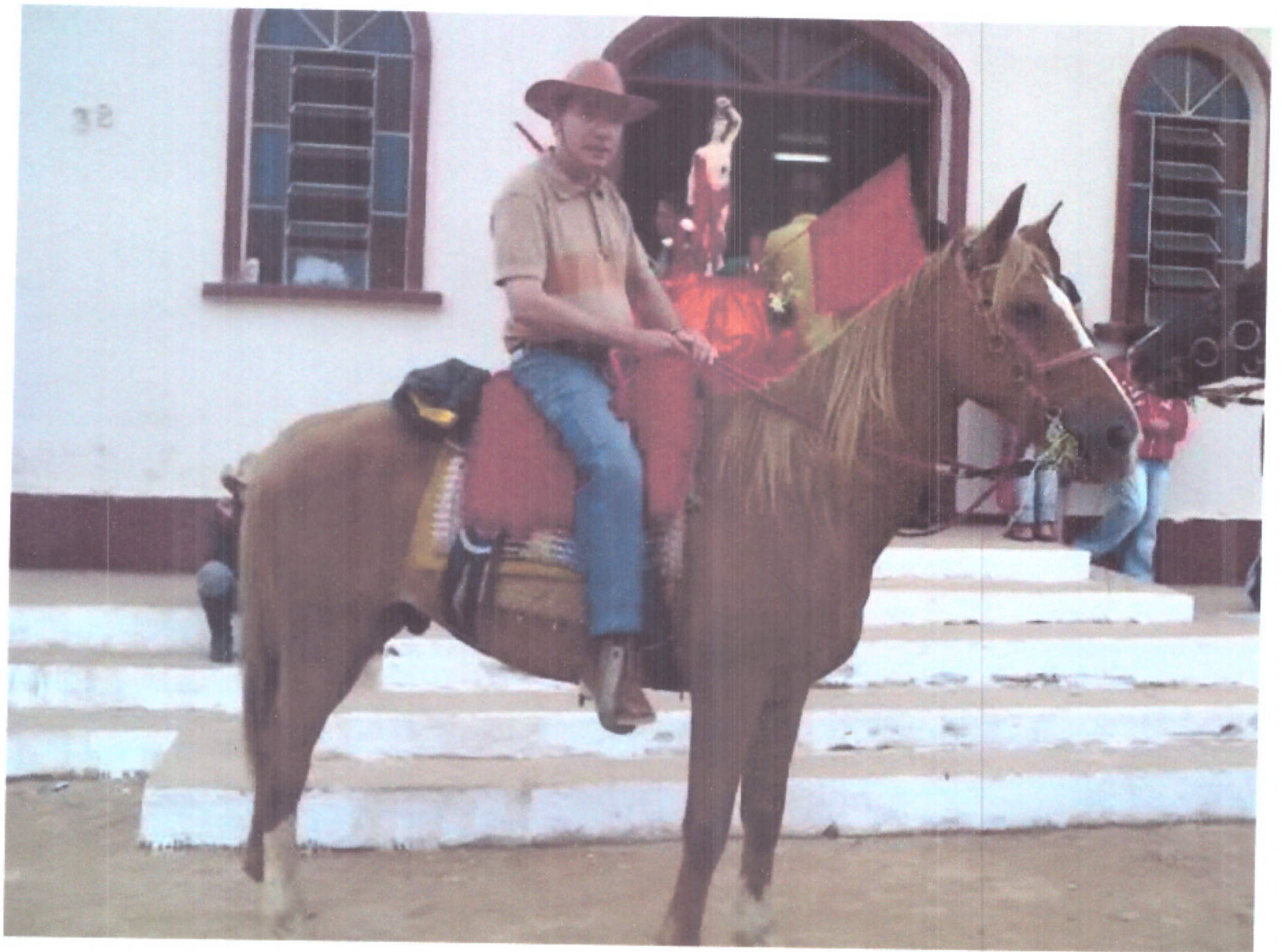
Cavalgada Bom Jesus de Araçaiiba