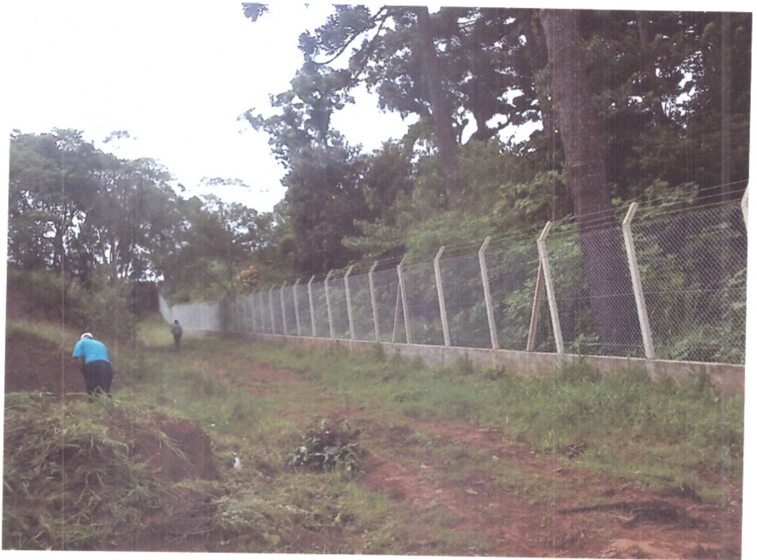
vista do alambrado do Horto Florestal e via de acesso; Foto realizada pelo próprio José Maria enquanto acompanhava as obras